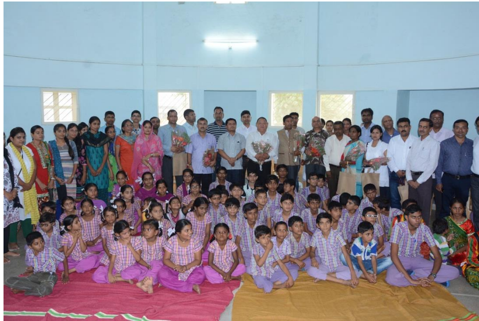
भूकम्प प्रभावित बालाबालीकाको लागि पुनर्निर्माण गरिएको विद्यालयको अवलोकन