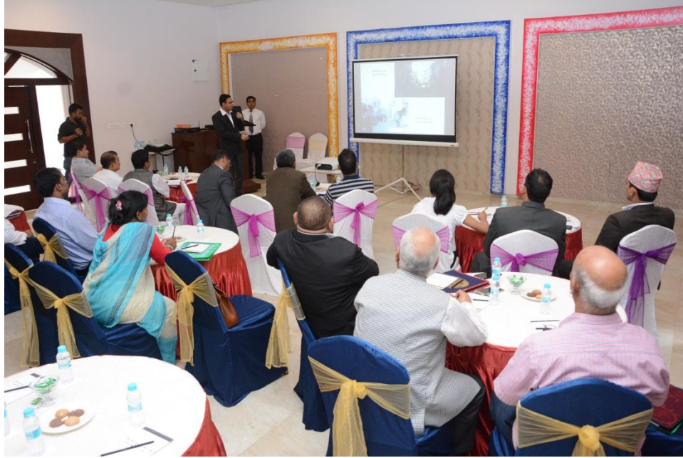
गुजरातको भुजमा गएको भूकम्पबाट भएको क्षति तथा पुनर्निर्माण सम्बन्धी ब्रिफिङ कार्यक्रम